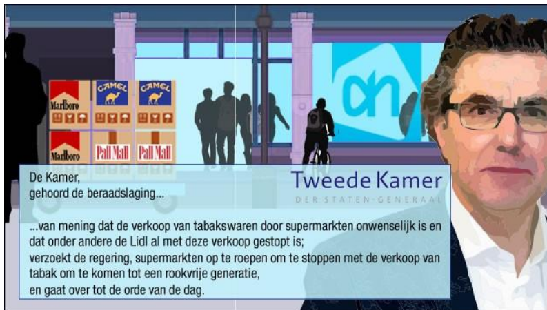
Henk van Gerven

De SP, en met name haar woordvoerder tabak Henk van Gerven, stelt zich geharnast op en stelt regelmatig vragen over artikelen die op TabakNee zijn verschenen.